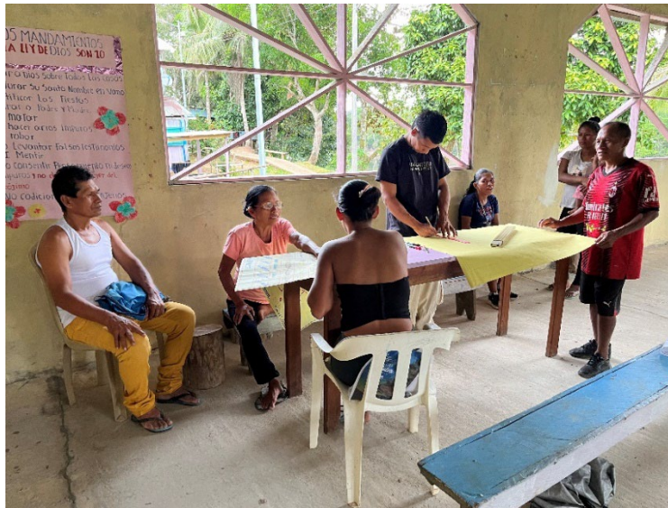
Desarrollo de actividades de formación: